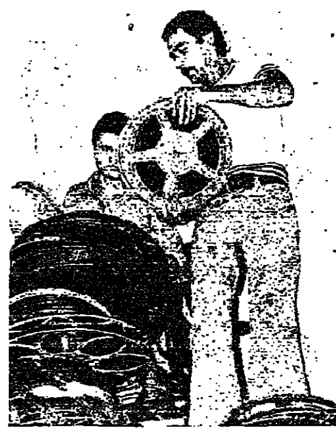
الانعام الصادرة